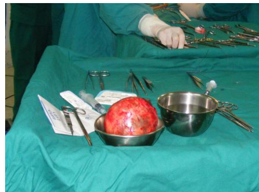
Big goiter Post extraction