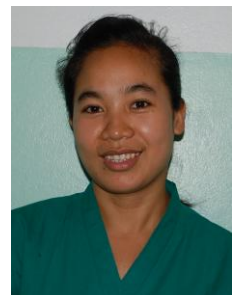
Mss. OuanPhavan OR Nurse