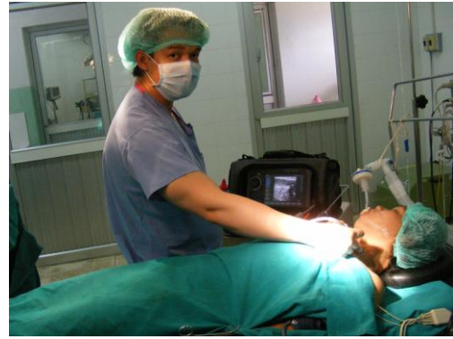
Nodule-goiter examined with ultrasound machine by: Dr. K. Keojampa (USA)