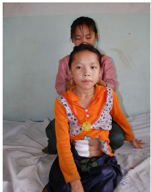
Appendicitis Post-surgery 3 rd day. Cost of surgery provided by LRF