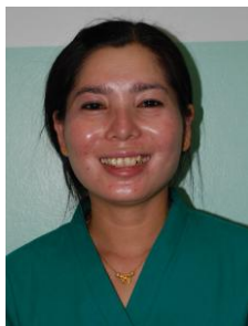
Mrs. Sommany OR Nurse