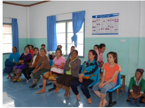
Patients waiting for exam